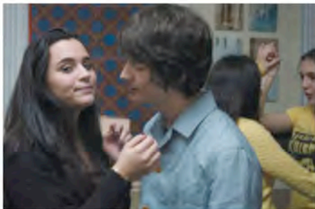
Nicolas's Kiss, Tete-a-Tete II, 03, 2007