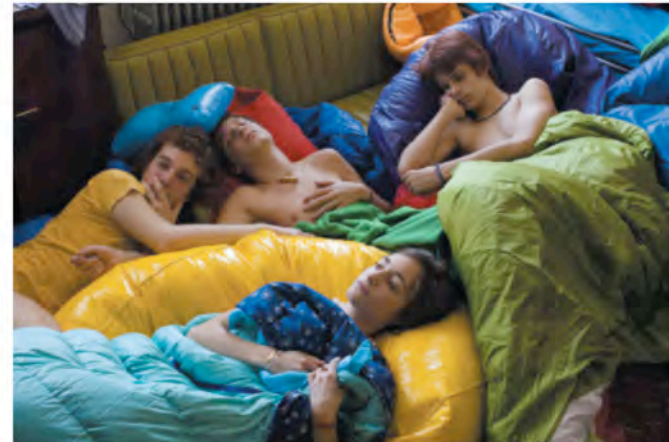
Sleepover Party : Dreaming, Tete-a-Tete V, 01, 2008