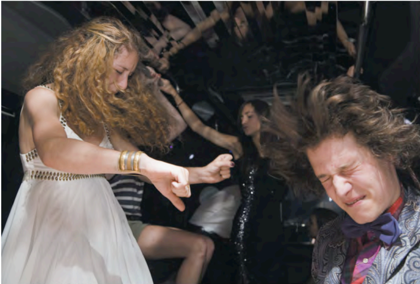
After Prom - Disco Bus Folly, Tete-a-Tete 11, 07, 2009