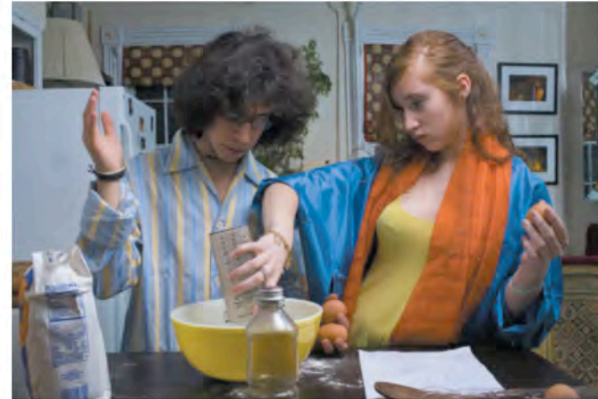
Sleepover Party : Les Crepes, Tete-a-Tete V, 01, 2008