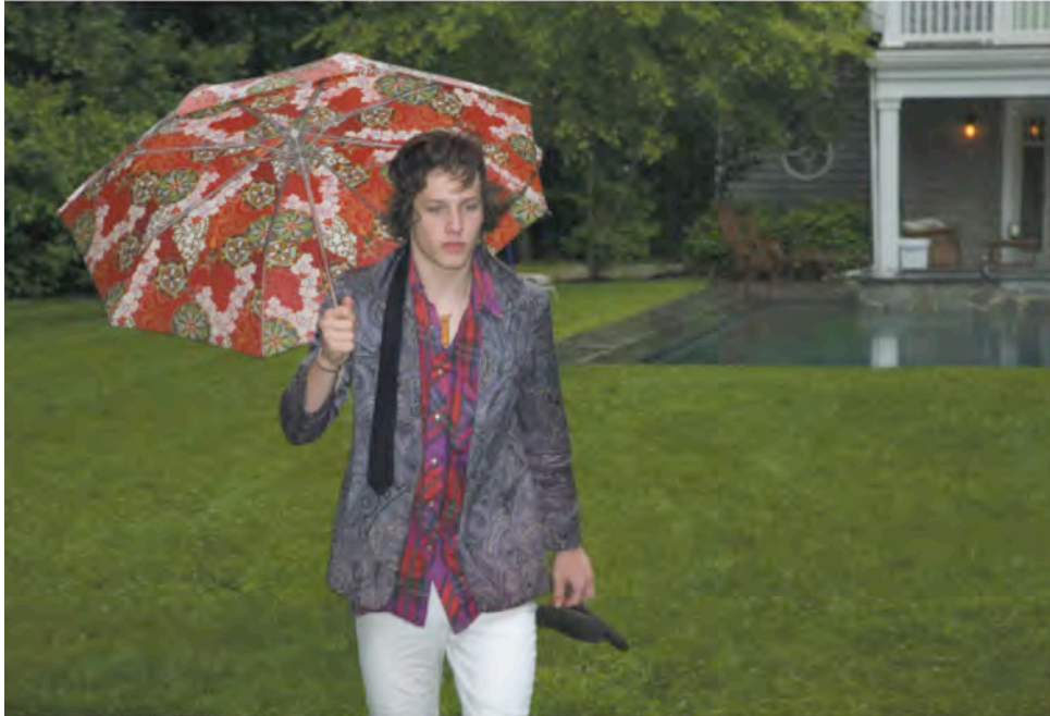
After Prom : Adrie's Red Drizzle, Tete-a-Tete 11, 07, 2009